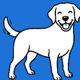
Hund an Bord (200-300€)