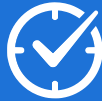
Early Check in (150€)