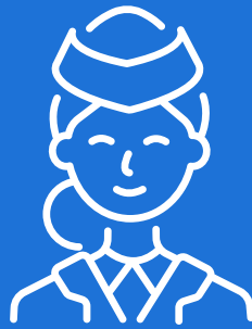
Hostess (ab 150€ pro Tag)